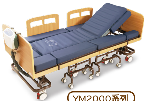
YM2000系列 名一分離式移位床 (未滅菌)